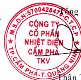
Phân Thế Đăng